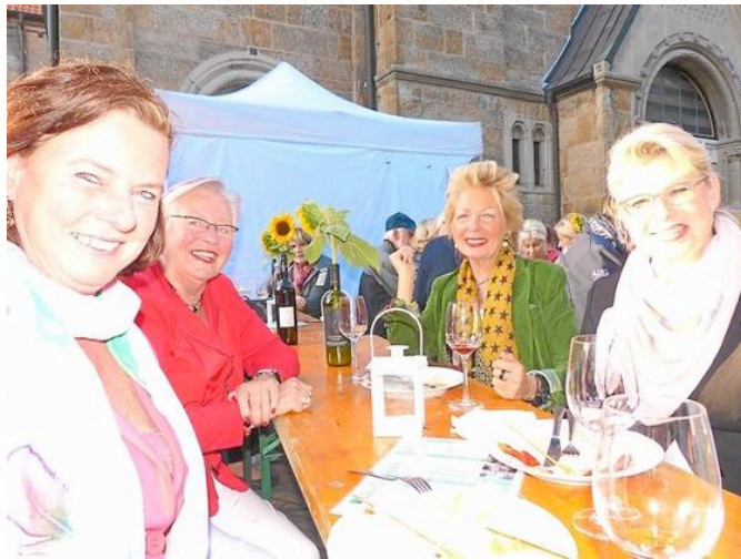
Strahlende Gesichter bei einem guten Tropfen Wein – die Stimmung beim Weinfest rund um St. Clemens konnte besser nicht sein.