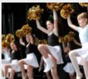
Hiltrup feiert sein...