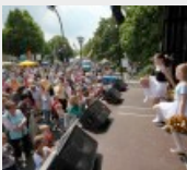
Hiltrup feiert sein...

Auf zwei Bühnen gab es zwei Tage lang volles Programm. Am Samstagabend sorgte die Band „Radspitz“ aus Bayern auf der Bühne vor der Clemenskirche für beste Partystimmung. Bis kurz nach Mitternacht spielte die Band, die vielen Münsteranern von der Kegelparty bekannt ist.