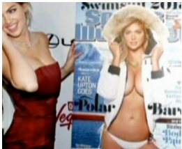
Topmodel begleitet Teenie zu Abschlussball