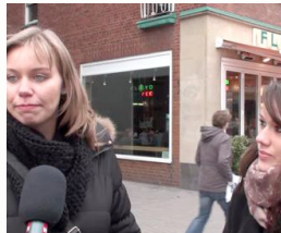
Umfrage: Wo kann man in Münster am besten feiern?